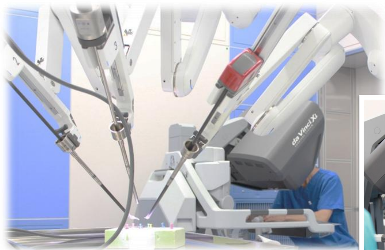
最新の手術支援ロボット（ダ・ヴィンチ）